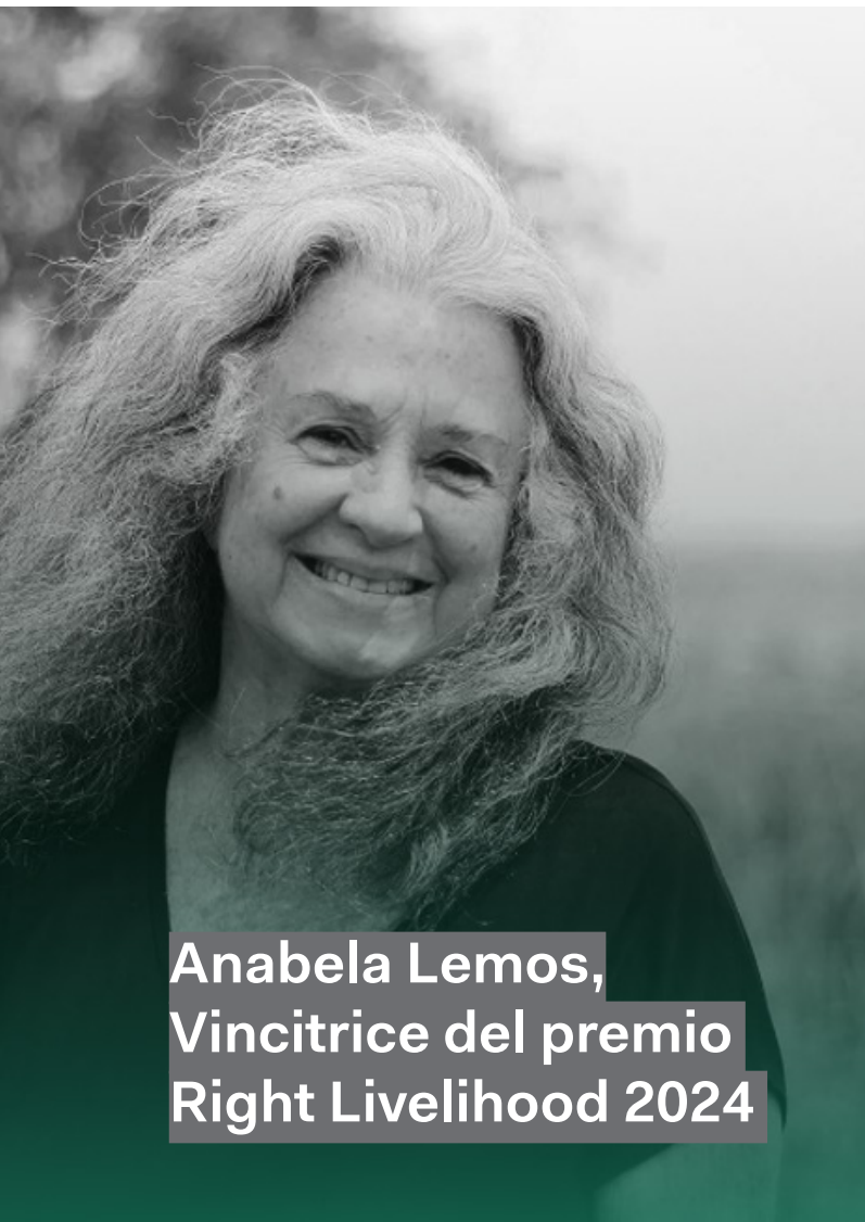
Anabela Lemos, Vincitrice del premio Right Livelihood 2024

L'Ufficio Stampa ha avuto l'onore di intervistare la vincitrice del Right Livelihood 2024 Anabela Lemos sul suo lavoro presso Justica Ambiental e sui suoi obiettivi nel prossimo futuro.