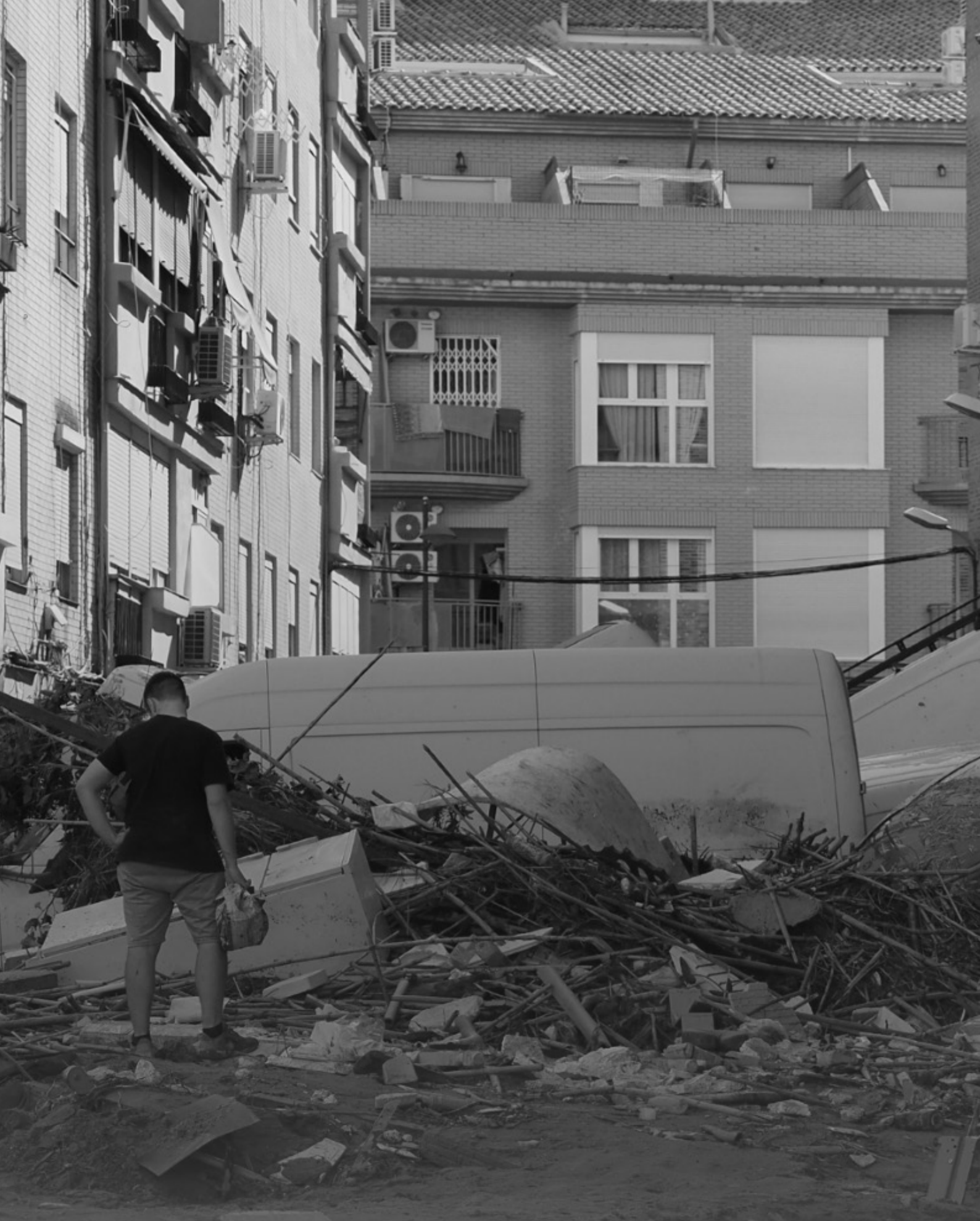
Crisi DANA di Valencia: Un Appello alla Responsabilità e all'Ascesa della Solidarietà Comunitaria in mezzo alla Catastrofe